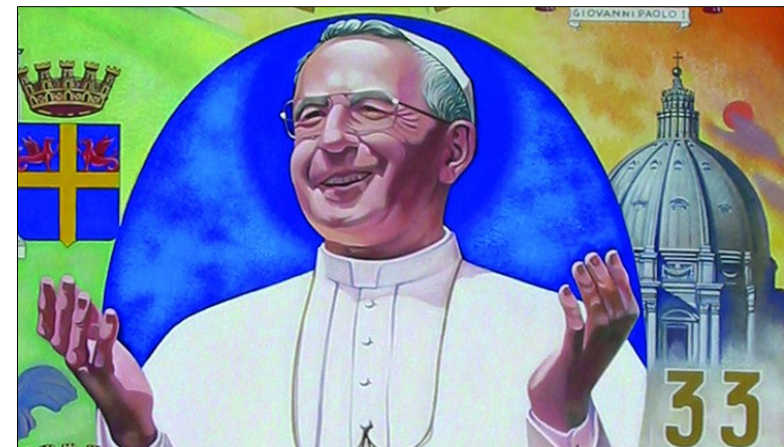
“Papa Luciani - Un percorso al servizio di Dio” (particolare)

Credo che questo dipinto rappresenti in modo originale e simbolico, ma di chiara lettura, il lungo percorso del Papa al servizio di Dio”. (L. Regianini)